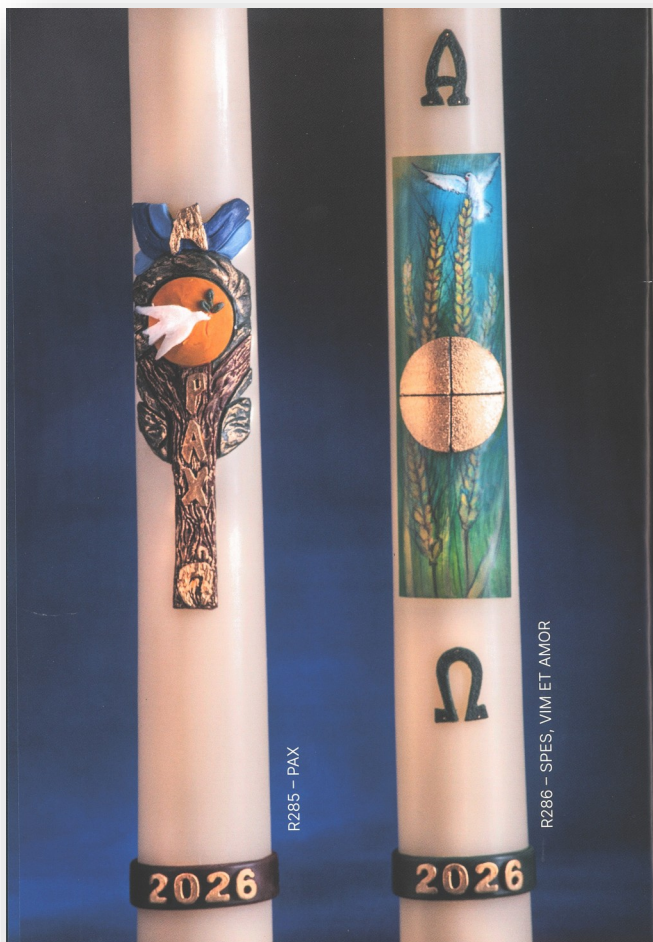
R285 – PAX