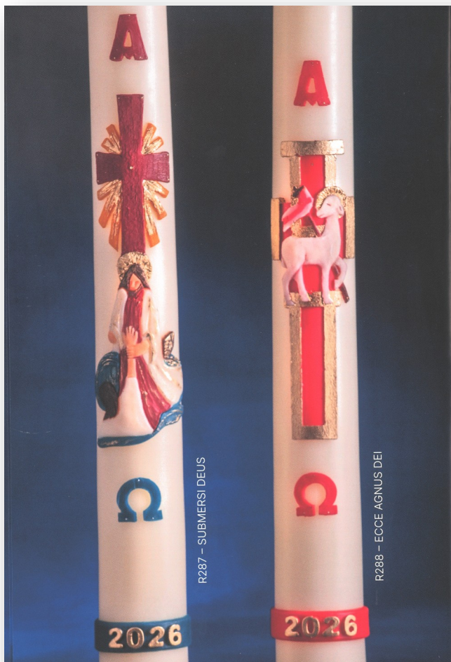
R287 - SUBMERSI DEUS